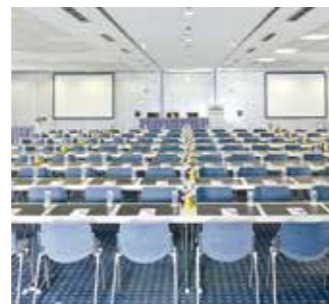
Tagungsraum Noris 1–6