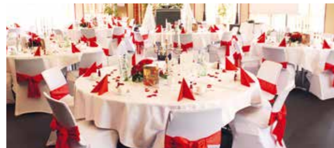
Tagungsraum Noris 11–12